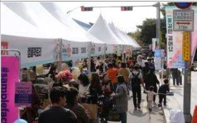
제3회 성수 도시재생축제 꽃길만 걸어요(2019.10.)