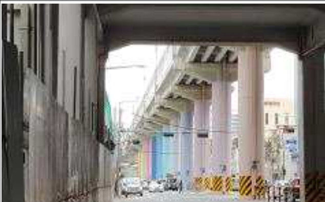
독점역 교각하부 경관개선