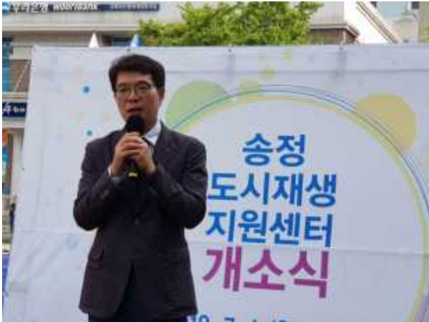
송정도시재생지원센터 출범 개소식