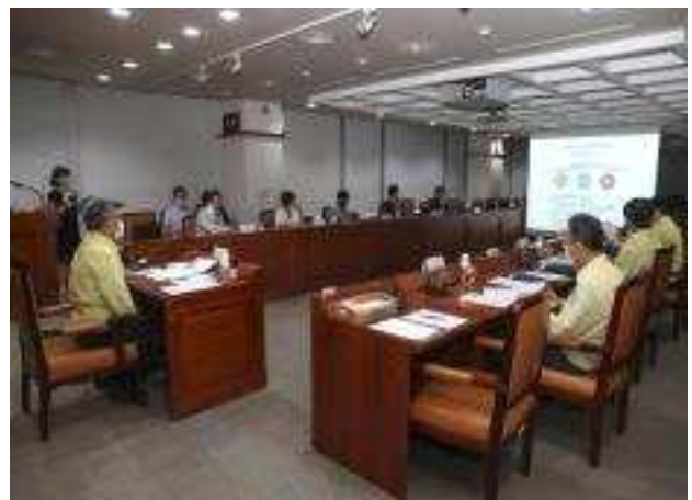
활성화계획(안) 구 도시재생위원회 자문(2020.7.22.)